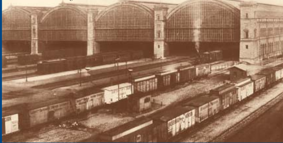
Historisches Foto aus der Zeit vor 1900 vom Münchener Hauptbahnhof mit zur Beladung abgestellten Brauerei-Privat-Bierwagen

Die Modelle aus dem Hause FINE SCALE MÜNCHEN sind begehrte Sammlerobjekte und werden in limitierter Stückzahl einzeln in Handarbeit hergestellt. Vollständig aus Messingformätzteilen gefertigt. Den Wagen liegen NEM-Kupplungsschächte zum Einbau von N-Standardkupplungen sowie originalgetreue Hakenkupplungsimitationen für die Verwendung als Vitrinenmodelle bei.